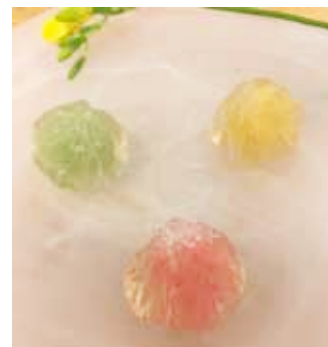
きんぎょかん 錦玉羹

※諸般の事情により講座が中止・変更となる場合がございますので、予めご了承下さい。