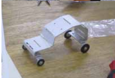
メタルパッチワーク・アート & 四輪おもちゃ製作教室