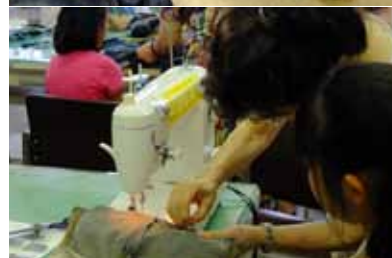
ジーンズでつくるバッグ製作教室