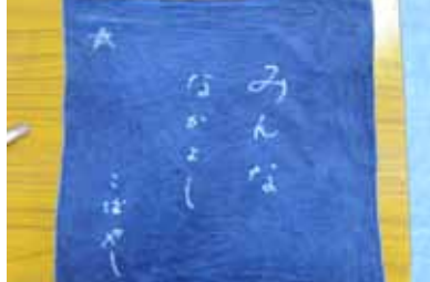
かわさきマイスターが教える ハンカチ藍染教室