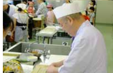
お寿司屋さんが教えるのり巻教室