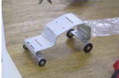
メタルパッチワーク・アート & 四輪おもちゃ製作教室