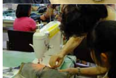
ジーンズでつくるバッグ製作教室