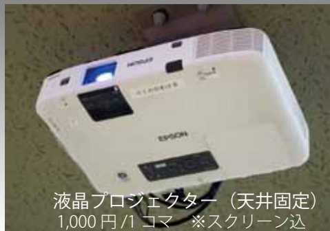
液晶プロジェクター (天井固定) 1,000円/1コマ ※スクリーン込