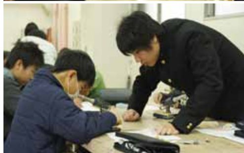
県立向の岡工業高校の生徒がサポート

ご年配の方は覚えていらっしゃるかもしれませんが、または、懐かしいと思う方も、なかにはいらっしゃるのではないのでしょうか。