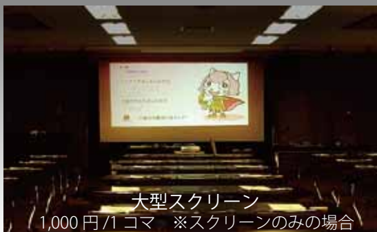
大型スクリーン 1,000円/1コマ ※スクリーンの場合

てくのホール 9-12時 5,300 13-17時 7,000 18-22時 9,700 第3研修室 9-12時 1,200 13-17時 1,600 18-22時 2,200 ※土・日・祝日は上記金額の2割増し。 講演会や研修会、 プレゼンテーション など、多目的にご活用 いただけます。 お問合せ・お申込み てくのかわさき (川崎市生活文化会館) TEL 044-812-1090 FAX 044-812-1117