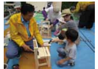
大工さんと椅子づくり♪

【お問合せ】 建設ユニオン川崎川崎支部（高津区久本3-16-11） 044-822-7412