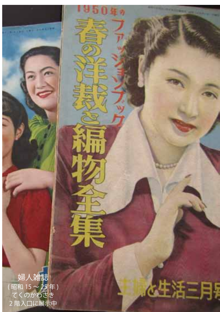
婦人雑誌 (昭和15~25年) てくのかわさき 2階入口に展示中