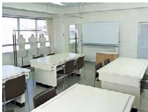
洋裁実習室(定員16名)