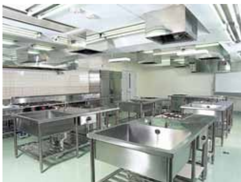
調理実習室(定員24名)