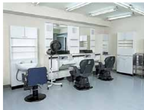
理容美容実習室(定員16名)