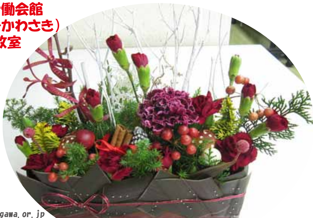
※作品写真は、イメージです。

sunpian@zai-roudoufukushi-kanagawa.or.jp 受付時間 9時00分～20時30分