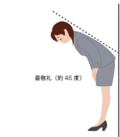
最敬礼 (約 45 度)