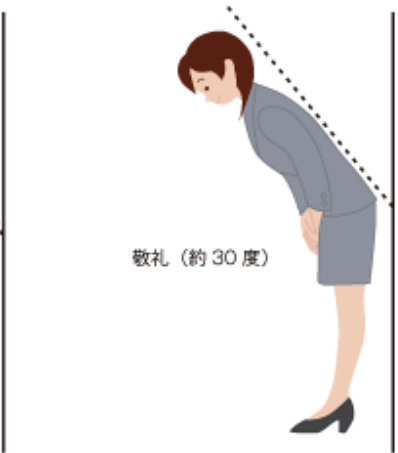
敬礼 (約 30 度)