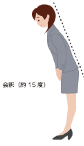
会釈 (約 15 度)